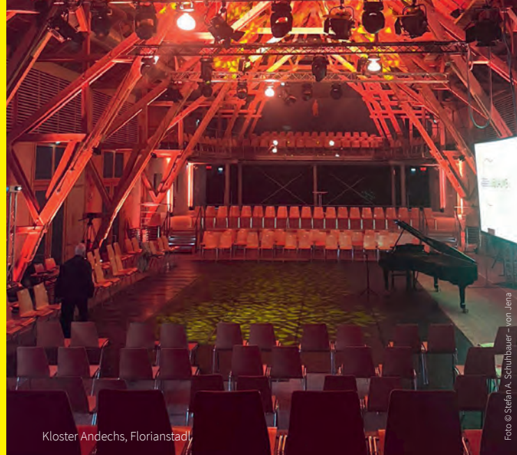
Kloster Andechs, Florianstadt

†400 WILLIAM BYRD †380 CLAUDIO MONTEVERDI *155 CARL FRÜHLING *150 SERGEI RACHMANINOV *150 MAX REGER †130 PETER I. TSCHAIKOWSKY *100 GYÖRGY LIGETI